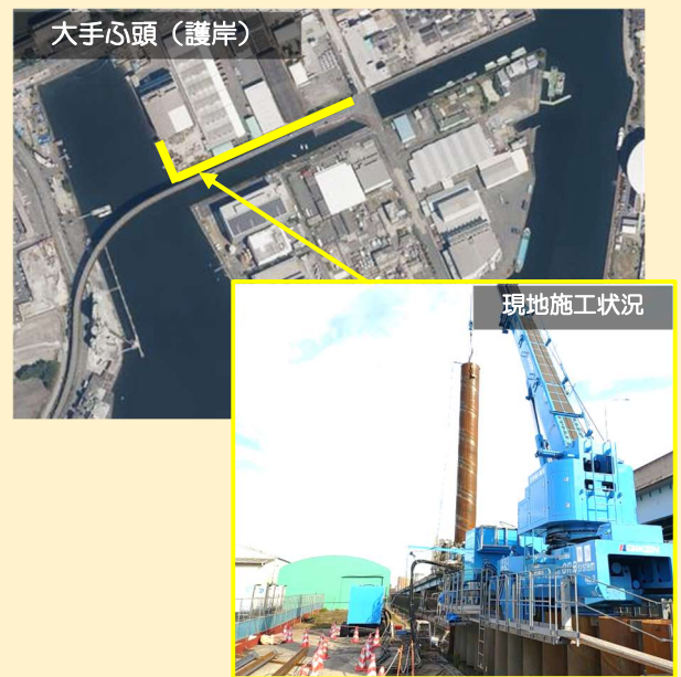
防潮壁の防災機能強化